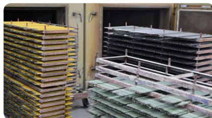
Kontrolovanie sušenia elektród v elektrických peciach pre optimálne zväracie vlastnosti