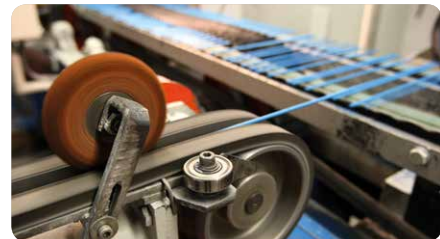
Obalovanie jadra tyčky v lisovniach elektród vo výrobnom závode Massen