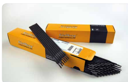
Drážkovanie s Kjelgouge