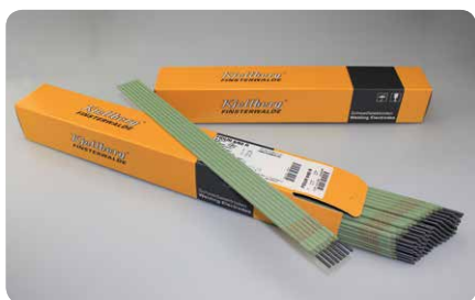
Naváranie, napr. s Fidur 6/60R

Na naváranie oteruvzdorných vrstiev pre najrôznejšie požiadavky máme v programe typy elektród Fidur a Filit . Lunkre (dutiny) a iné chyby v odliatkoch odstránite s elektródami z rady Ficast . Tri typy elektród pre rezanie, príp. drážkovanie dopĺňajú kompletný sortiment práve tak pre jednotlivé krajiny ako aj a pre konkrétne aplikácie produktov. Ak aj napriek potrebnú odrodu nenašli vhodnú elektródu, opýtajte sa na naše podmienky a možnosti pre špeciálne prevedenie.