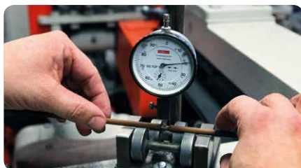
Prebiehajúca skúška obalovania v procese výroby