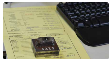
Skúšobný kus jednej šarže elektródy so skúšobným protokolom