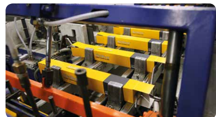
Balenie produktov na baliacej linke