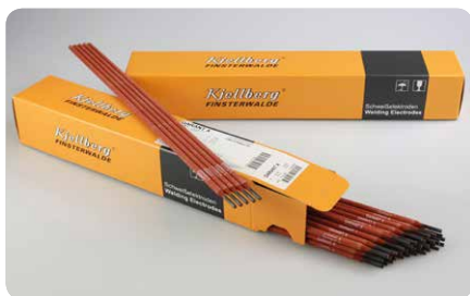
Zváranie nelegovanej ocele, napr. s Garant X

Najväčší výber ponúkame pod označením Finox pre zváranie ušľachtilej ocele. Na základe čísla materiálu alebo druhu ocele stanovíte vhodné elektródy. Použite k tomu našu brožúru elektród, pokyny pre aplikáciu na našich webových stránkach alebo nám zavolajte.