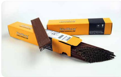
Zváranie vysokolegovanej ocele, napr. s Finox 4370 AC

Na naváranie oteruvzdorných vrstiev pre najrôznejšie požiadavky máme v programe typy elektród Fidur a Filit . Lunkre (dutiny) a iné chyby v odliatkoch odstránite s elektródami z rady Ficast . Tri typy elektród pre rezanie, príp. drážkovanie dopĺňajú kompletný sortiment práve tak pre jednotlivé krajiny ako aj a pre konkrétne aplikácie produktov. Ak aj napriek potrebnú odrodu nenašli vhodnú elektródu, opýtajte sa na naše podmienky a možnosti pre špeciálne prevedenie.