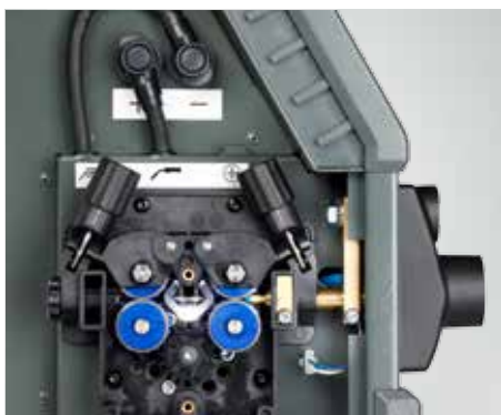
Světlo LED v konzole podavače drátu (číslo položky 78861545)