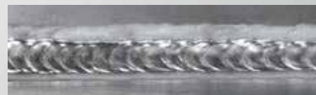
DUO Plus™ - Hliník

Funkce zlepšuje kontrolu tavné lázně a snižuje vnesené teplo.