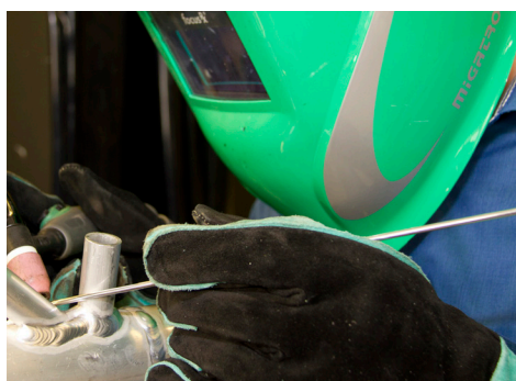
Focus TIG 200 AC/DC PFC svařuje všechny materiály včetně hliníku

Hořák stroje Focus TIG 200 AC/DC je osazený wolframovými elektrodami MIGA Super Blue, které mají vynikající vlastnosti při zapalování i opětovném zapalování oblouku a jsou použitelné pro všechny druhy materiálů.